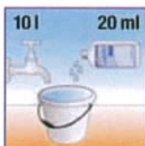
Dem Wischwasser 1 Schuss (ca. 20 ml) zugeben.

Es ist zu beachten, dass das Wischwasser rechtzeitig gewechselt wird!