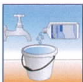
Produkt mit Wasser 1:10 verdünnen

Nach der Einwirkzeit fährt man den Bodenbelag mit einer Einscheibenmaschine unter Verwendung eines weißen oder roten Pads ab. Die Schmutzflotte muss sofort mit einem Wasserauger abgesaugt werden. Anschließend muss der Belag mit klarem Wasser gespült werden. Nach ca. 15 Min. Trockenphase kann man den Bodenbelag wieder betreten.