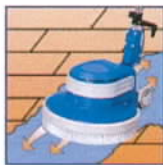
Auf vorgemäster Fläche mit Ein- scheibenmaschine scrubben.