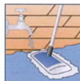
Mit frischem Wasser gut nachspülen.