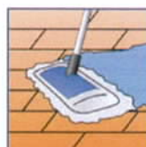
Boden nassfeucht wischen.