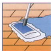
Boden feuchtnass einlegen.