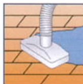
Absaugen der Schmutzflotte